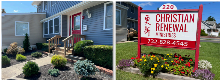
更新门前花团锦簇，绿意盎然